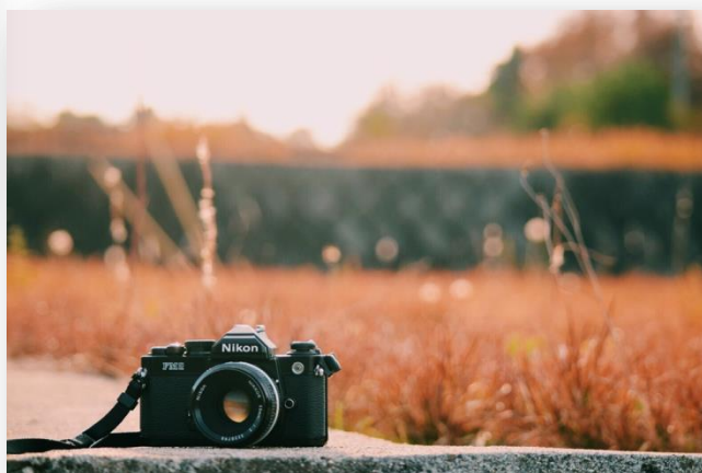
優秀賞「秋とカメラ」