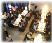
身近な地域の 出会いイベント 「こいのわかフェ」