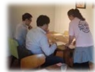
こいのわボランティア が出会いをサポート

(参考) 平成30年度の事業ターゲット (県調査※25～39歳独身が対象 (平成30年1月))