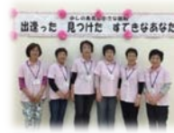
地域で活動する ひろしま出会い サポーターズ