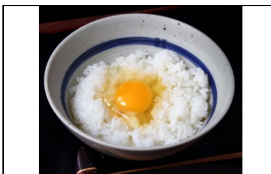
シフォンケーキ、白身メレンゲ、卵かけごはん