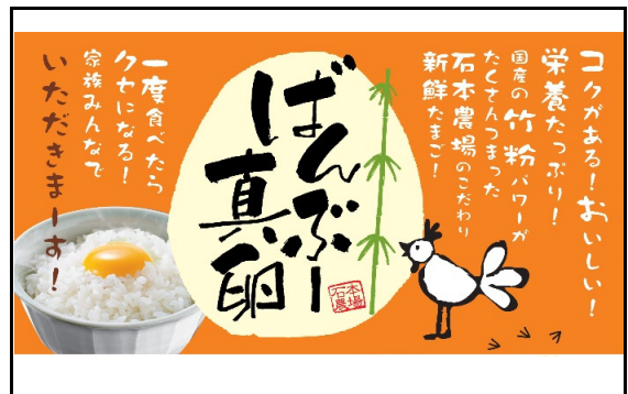
真卵チラシの一部