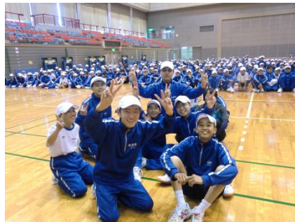
(生徒会レクリエーション)