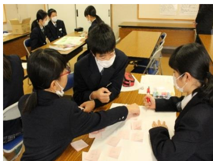
(生徒会リーダー研修)