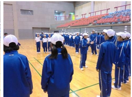
(3年を中心に各団の校歌練習)