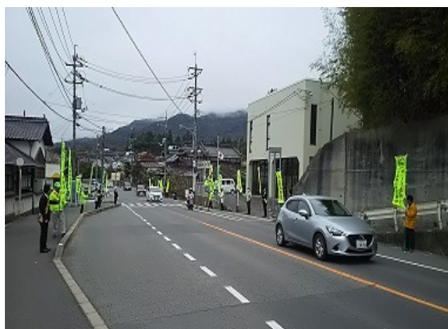
交通安全早朝街頭キャンペーン 4/5 熊野町東公民館前