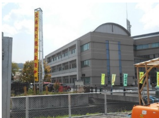
のぼり旗、懸垂幕設置 庁舎周辺