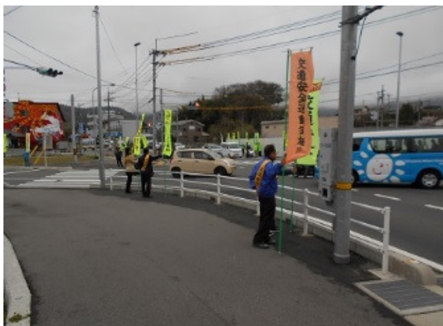
交通安全早朝街頭キャンペーン 4/5 熊野町役場前交差点