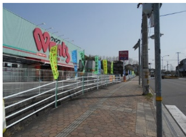
のぼり旗設置 熊野団地入口付近