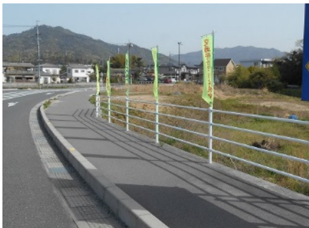
のぼり旗設置 具出橋付近