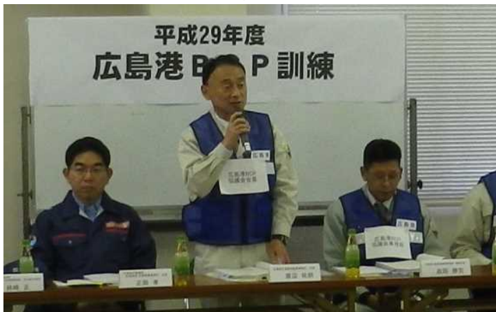
《広島港BCP訓練の様相》