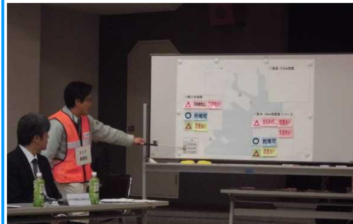
《福山港BCP訓練の様相》