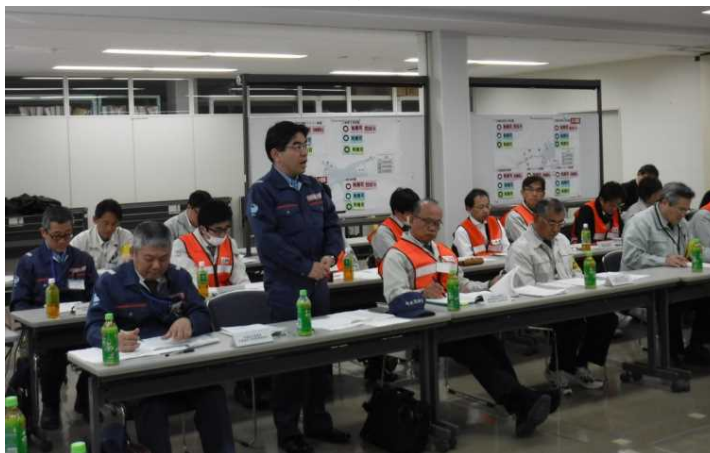
《尾道系崎港BCP訓練の様相》