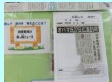
関心を持った新聞記事をスクラップし感想を書いて掲示