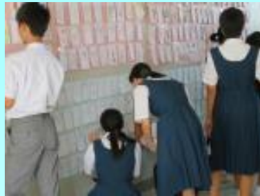
しおりコンテスト (読書に関する川柳・イラスト)