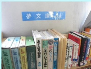
「図書委員セレクト本」を入れた学級文庫