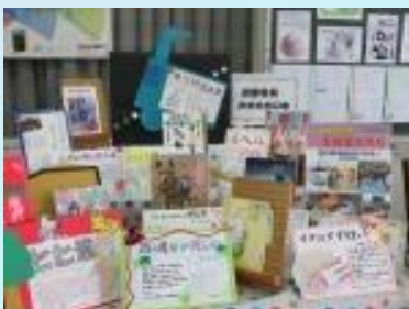
ポップを作って「図書委員お薦めの本」コーナー