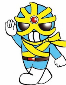
反射材活用促進キャラクター(広島県警)