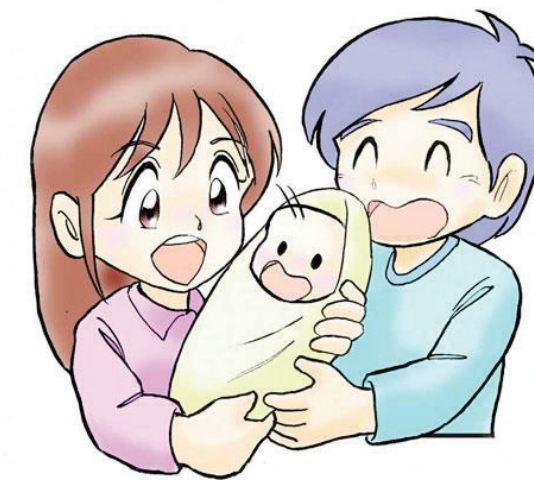
イラスト：うじな かずひこ

自分のお腹に新しい命が宿っていると知ったとき、あるいはパートナーの妊娠を知ったとき、あなたは、どんな気持ちになりましたか。喜びやうれしさだけでなく、驚き、戸惑い、不安、責任感など、複雑な感情を抱いた方もいるかもしれません。しかし、そんなことは生まれてくる赤ちゃんには関係ありません。生まれてくる命は、あなたの命がそうであるように、かけがえのない大事な命。その命を守り育てる「親」というものについて、少し考えてみませんか。