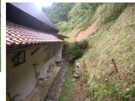
神石郡 神石高原町 有木