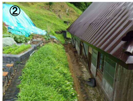
山県郡 北広島町 細見