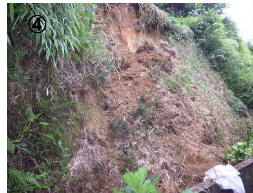
安芸郡 府中町 みくまり3丁目