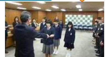
平成28年度・29年度各1名が受賞