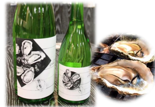
焼きがきに一途な純米酒