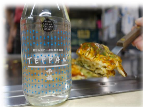
お好み焼に一途な発泡清酒