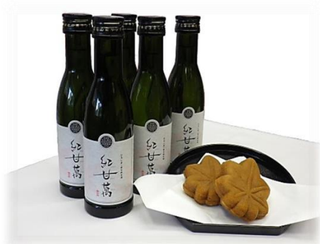
もみじ饅頭に一途な純米酒