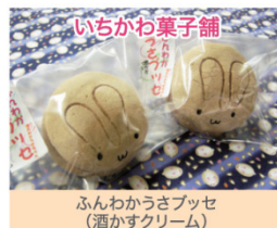
ふんわかうきブッセ (酒かすクリーム)