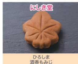
ひろしま 酒香もみじ