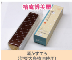
酒かすてら (伊豆大島椿油使用)