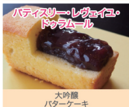
大吟醸 バターケーキ