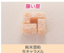
純米酒粕 生キャラメル