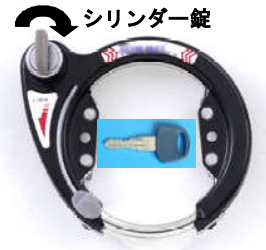
【JIS規格】 シリンダー錠

被害を防止するため、JIS規格のシリンダー錠を使用することに加え、ワイヤー錠やU字型錠などを併用したツーロックを習慣づけましょう。