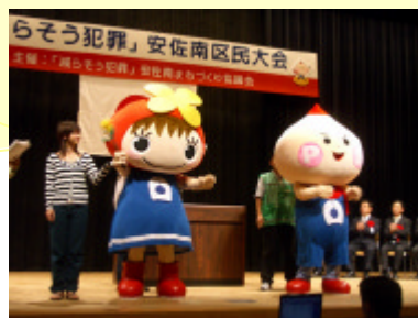
初登場のみはるちゃんとみまわりくん。今後の活躍が期待されます。