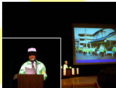
シニアウォーキングパトロール隊の活動報告。「腕章・ジャンパーなど行政からの支援が活動のきっかけに...」との提言も。