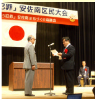
地元ライオンズクラブから協議会に電光掲示板2基が贈呈されました。

10月9日(日)、「減らそう犯罪」住民・行政・警察協働モデル事業を展開中の広島市安佐南区で、区民大会が開催されました。オープニングセレモニーでは、昨年の区民大会で発表された協議会のマスコットキャラクター「みはるちゃん」「みまわりくん」の着ぐるみ人形が初登場。モデル事業によるこれまでの取組みが紹介され、続いて、「防犯少年団 安佐南まもるんジャー」を筆頭に防犯ボランティア団体の活動発表が行われました。