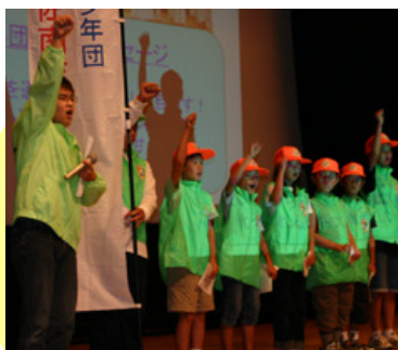
「大人のみなさん、本気で僕たちを叱ってください！」子ども達からのメッセージがとても印象的でした。