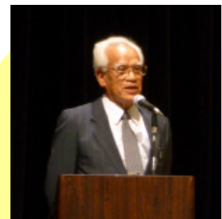
自治会ぐるみで全戸に防犯ベルを設置した取組みについて紹介。助けあいの精神が地域づくりにつながりました。