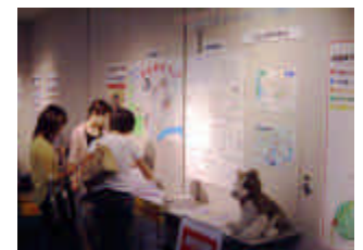
応募作品は8月29日広島市まちづくり市民交流プラザで展示されました。