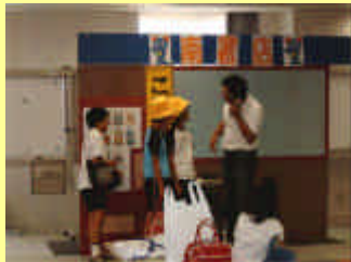
広島市まちづくり市民交流プラザにて

8月29日、広島青年会議所主催のイベントで広島南署管内の小学生と少年補導員さんが「子ども110番の家」をテーマとした寸劇を披露しました。観客の子どもたちも真剣に見入っていました。