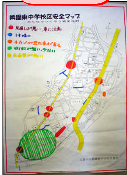
広島市立 祇園東中学校