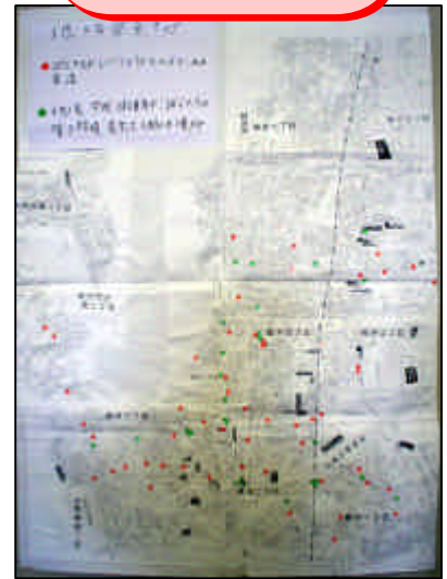
広島市立 緑井小学校