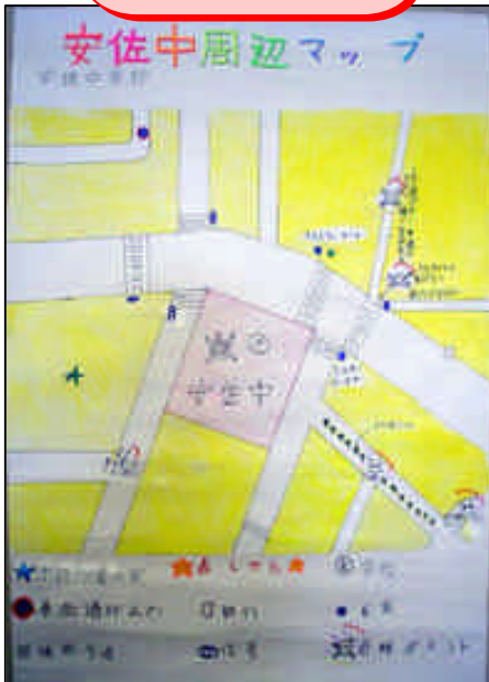
広島市立 安佐中学校