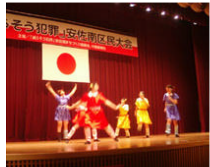
舞踊(安田女子大学舞踊研究部)