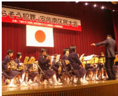
吹奏楽部演奏(広島市立城南中学校)