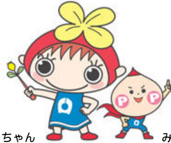
みはるちゃん みまわりくん