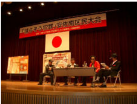
なりすまし詐欺防止寸劇(はたほり劇団)