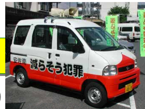
【「減らそう犯罪」安佐南まちづくり協議会の「減らそう犯罪カー」】