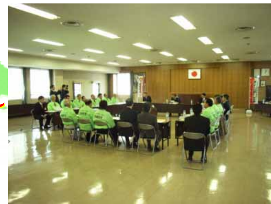
【「減らそう犯罪」安佐南まちづくり協議会役員と懇談する沓掛国家公安委員会委員長】