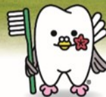
広島県歯科医師会イメージキャラクター 「はっぼくん」