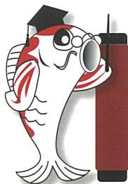
広島県高齢者向け消費者啓発キャラクター 「かしこい先生」