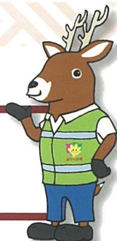
「減らそう犯罪」広島県民総ぐるみ運動 マスコットキャラクター「モシカ」