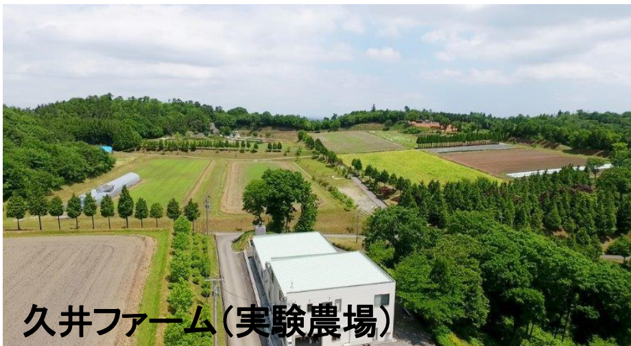
久井ファーム(実験農場)