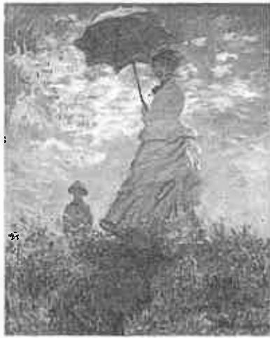
作品名〔散歩、日傘をさす女〕 作者名〔クロード・モネ 1840～1926〕

1 次に示すクロード・モネの「散歩、日傘をさす女」を生徒に提示して鑑賞させる授業を行うこととします。この作品の鑑賞を通して、生徒に理解させたい表現の特徴は何ですか。簡潔に書きなさい。