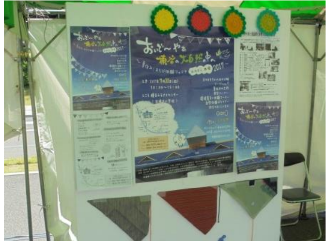
イベント案内、エコたわし・箸袋の展示