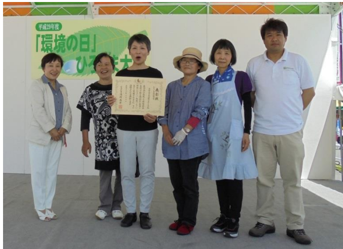
ひろしま環境賞受賞