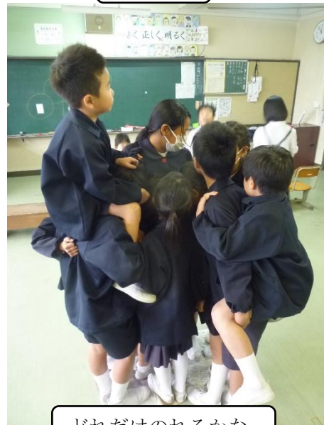
どれだけのれるかな