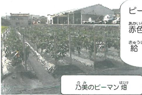
乃美のピーマン畑

ピーマン畑に行ってみたら、きれいな赤色になったピーマンがあったので、給食で使うことにしました。