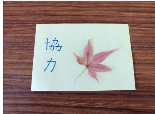
②台紙に、①の木の葉を置く。 ※ 余白の部分に、名前や自分の好きな言葉などを書いたりしてもよい。 ※ 厚みのあるものは、機械に入らないこともあるので注意する。