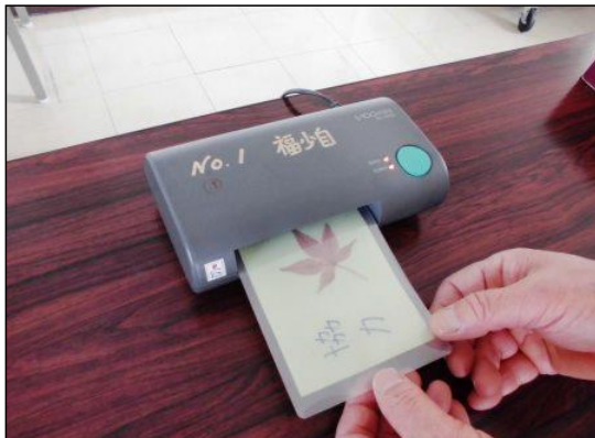
④ ③をラミネート加工機に通す。（まっすぐ差し込む） ※ 機械のランプが2つともついたのを確認してからフィルムを通す。