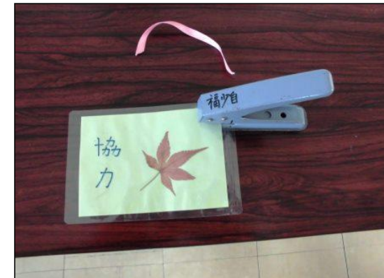
⑥ ラミネート加工したフィルムに、パンチで穴をあけ、リボンをつけてできあがり。 ※ 穴をあける位置や、リボンの結び方を工夫する。