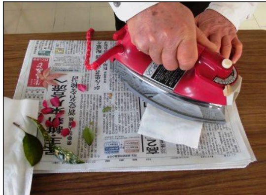
①新聞紙の上に木の葉を置き、その上にティッシュペーパーをのせて、アイロンで押さえ、水分をとばす。（10～20秒位） ※ やけどに注意。