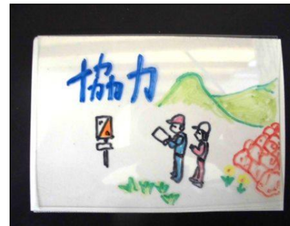
③ プラスチック板に裏から色マジックで色をつける。 ※ 色はあまり重ねてぬらない。