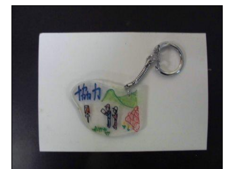
⑧ 金具を取りつけて完成。