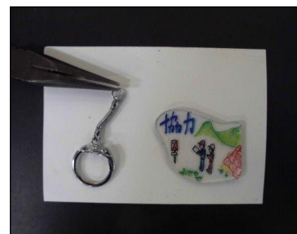
⑦ ラジオペンチで金具の小さいリングを写真のように前後に開いて、プラスチック板に取りつける。