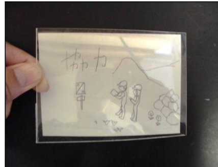
② 下絵の上にプラスチック板を置いて、マジックでりんかくをうつす。