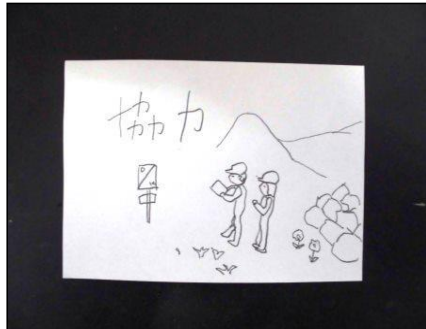
① 紙 (9×13cm) に下絵をかく。