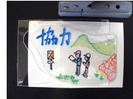
④ かどを丸くはさみで切る。パンチで金具をとりつける穴をあける。 ※ 好きな形に切ってもよい。 なるべく大きめに切る。 ただし、かどは丸くしておく。