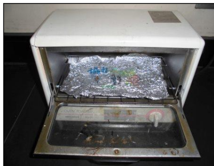
⑤ オープントースターの中に手でもんで広げたアルミニウムはくをしき、加熱しておく。加熱していたアルミニウムはくの上にプラスチック板をのせると、曲がりながら約20秒で平面にもどり、1/4位にちぢむ。 ※ たくさん色をぬった面を上にする。手袋を使用する。