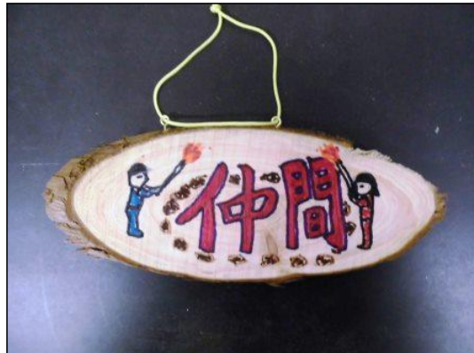
⑤ 組みひもをつける。