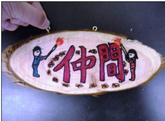
④ ヒートンを取り付ける。 ※ 押しながらねじ込む。