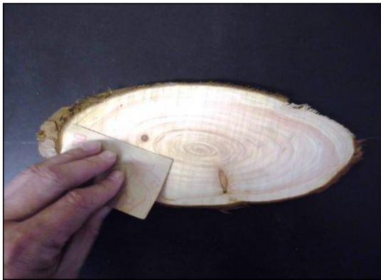
① サンドペーパーで表面を磨く。 ※ 凹凸があると、絵や文字が書きにくいので、できるだけなめらかにする。