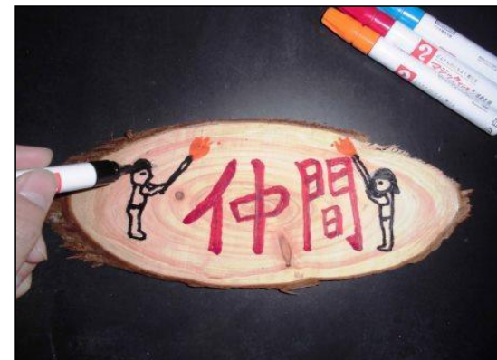
③ 絵の具やマジックで着色する。