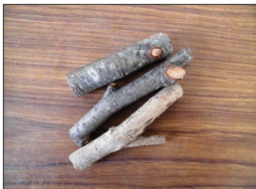
① 施設が準備した木の枝を、のこぎりで必要な長さに切る。