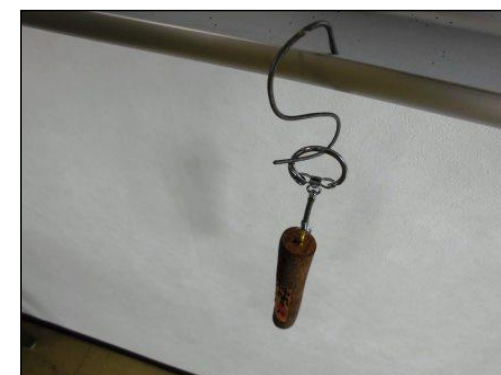
⑥ S字はりがねにかけて、ボンドが透明になるまでよく乾かす。