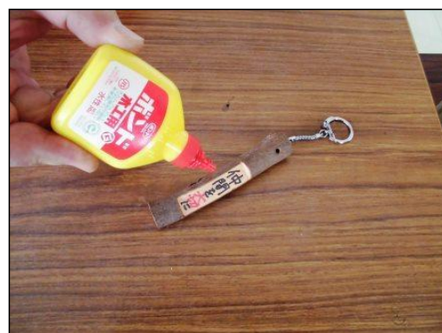
⑤ 文字を書いた箇所をボンドを塗る。 ※ボンドの塗り具合は、文字がうっすら見える程度。