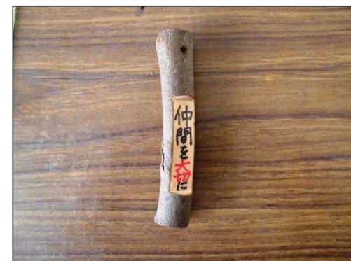
③ 削って平らな部分に文字や絵にかく。