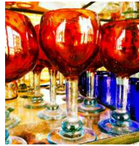
ワイングラス 気泡が残るのはリサイクルした証。金を使ってつくる赤いガラスは一番値が張ります。