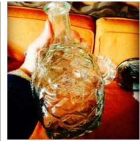
テキーラのボトル 製品はすべて注文を受けてから作ります。テキーラのボトルは個性豊か。これは...パイナップル型。