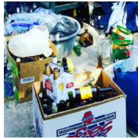
材料はお酒の空き瓶 外には近所の家庭やレストランから集めたお酒の空き瓶が山積み。まずは色別に仕分け作業から。