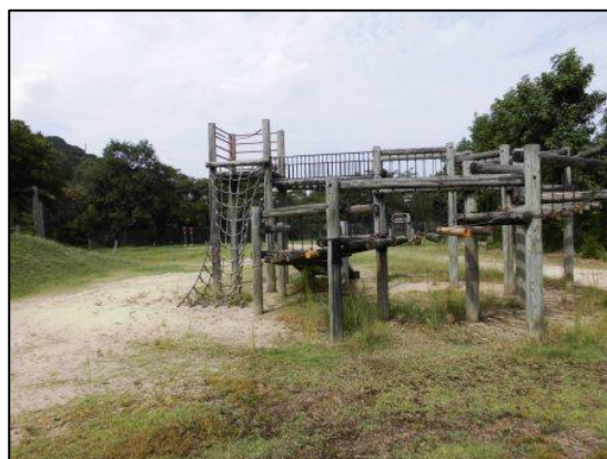
アスレチック（6種類）