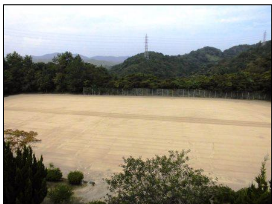
スポーツ広場（サッカーコート1面分）