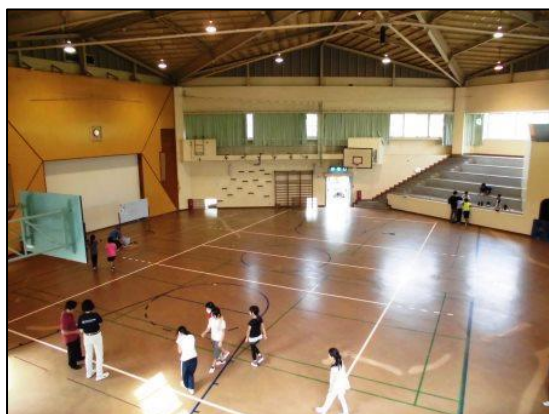
体育館（床は木材ではなくラバーです）