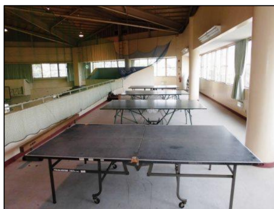
卓球台（4台、上靴が必要です）