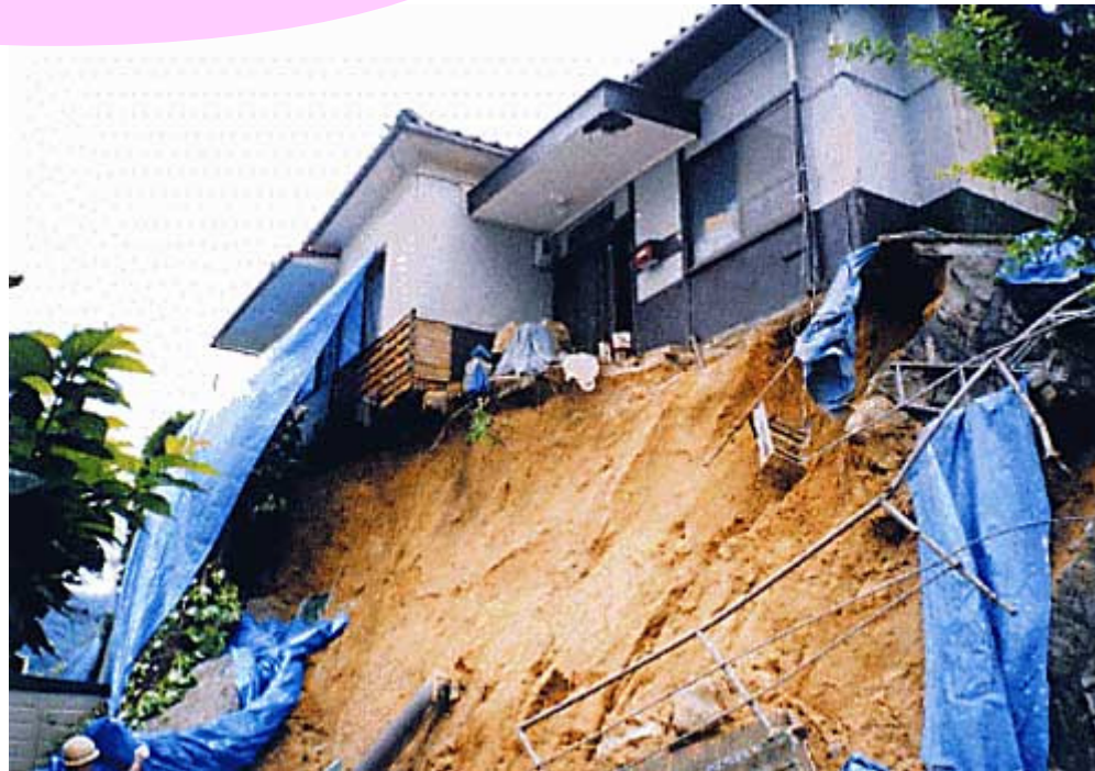
呉市における宅地被災事例