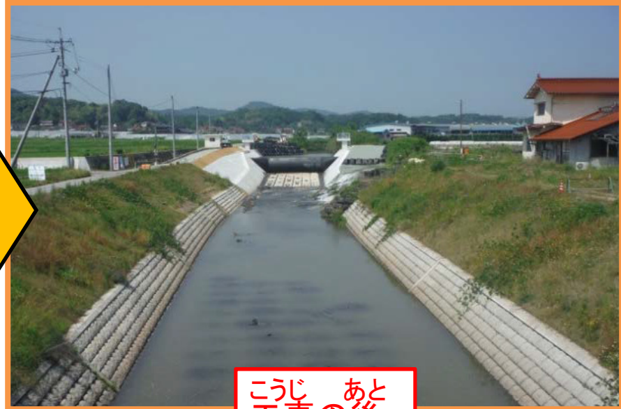
こうじ あと 工事の後

おおあめ かわ みず ふせ かわ はば 大雨のときに川の水があふれるのを防ぐため、川の幅を ひろ 広げたり、 ふか 深くする こうじ 工事をします。 (広島県ホームページより)