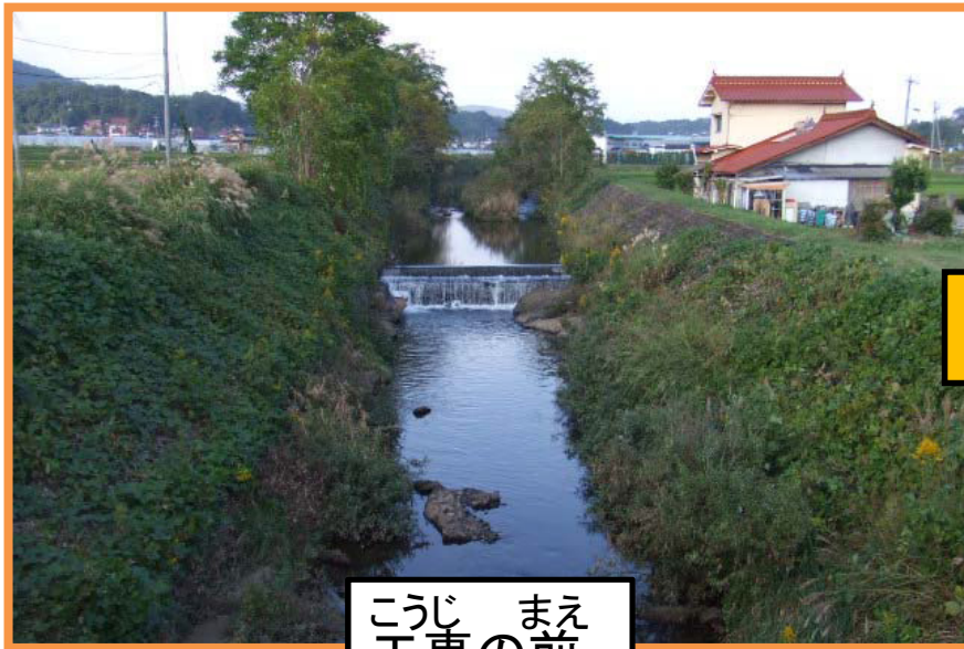
こうじ まえ 工事の前