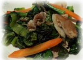
「ぶた肉と広島食材のたっぷりいためもの」 (1月26日)