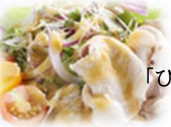
「ひろしまドレみそ ♪レモン」 (1月25日)