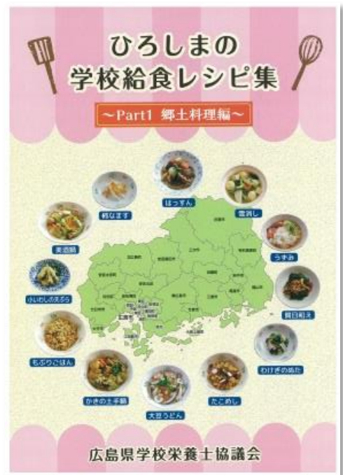
—広島県学校栄養士協議会作成のレシピ集—

※ 広島県学校栄養士協議会は、県内の学校・共同調理場等に勤務する栄養教諭及び学校栄養職員等で構成され、学校給食の充実並びに学校における食育の推進などを目標に、様々な活動に取り組んでいます。