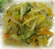
「せとうち さっぱりサラダ」 (1月30日)