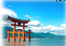
「ひろしまじゃけえ！ねぎちり揚げ」 (1月24日)