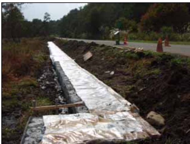
町道沿い観察路の工事風景