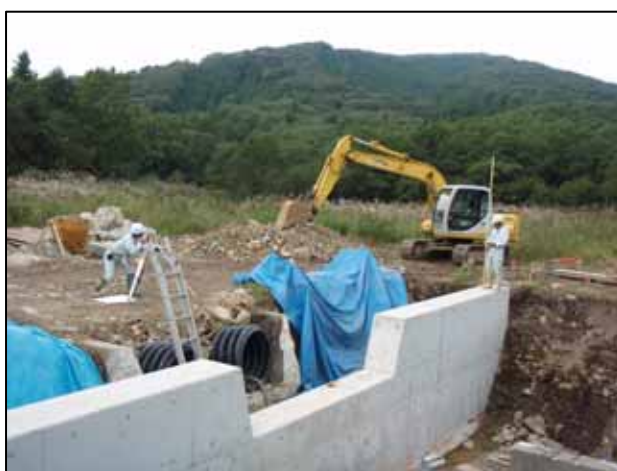
最下流部の床固工の工事風景