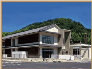
たけはら(竹原市) 住所/竹原市本町1丁目1-1 電話/(0846)23-5100