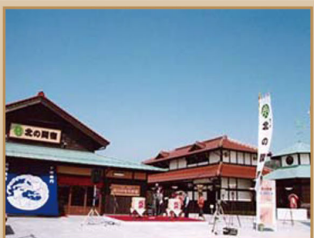
北の関宿安芸高田(安芸高田市) 住所/安芸高田市美土里町横田331 電話/(0826)57-1657