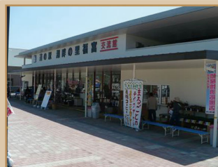
湖畔の里福富(東広島市) 住所/東広島市福富町久芳1506 電話/(082)435-2110