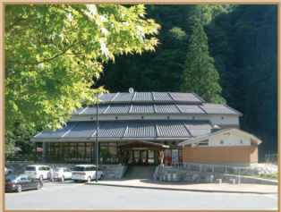
スパ羅漢(廿日市市) 住所/廿日市市飯山21-5 電話/(0829)72-2221