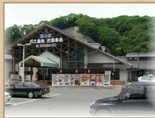
遊YOUさろん東城(庄原市) 住所/庄原市東城町川東471 電話/(0847)72-4444