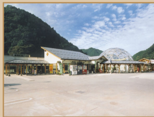
リストアステーション(庄原市) 住所/庄原市総領町下領家1-3 電話/(0824)88-3050