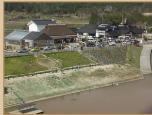
豊平どんぐり村(北広島町) 住所/山県郡北広島町都志見2609 電話/(0826)84-1313