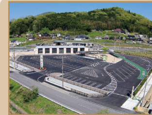
世羅(世羅町) 住所/世羅郡世羅町大字川尻2402-1 電話/(0847)22-4400