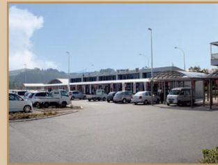
舞ロードIC千代田(北広島町) 住所/山県郡北広島町有田1122 電話/(0826)72-0171