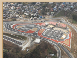
みはら神明の里(三原市) 住所/三原市糸崎四丁目2-1-1 電話/(0848)63-8585