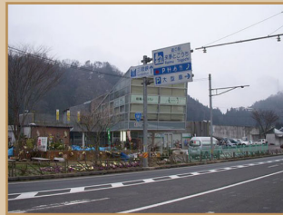
来夢とごうち(安芸太田町) 住所/山県郡安芸太田町大字上殿632-2 電話/(0826)28-1800