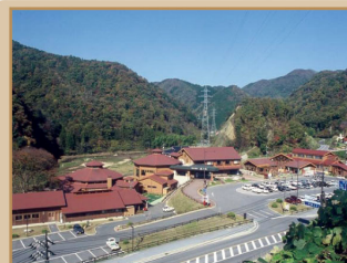
ぶおレスト君田(三次市) 住所/三次市君田町泉吉田311-3 電話/(0824)53-7021