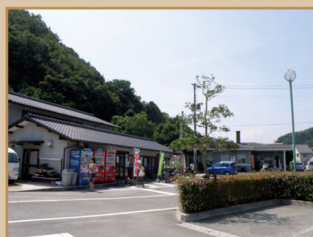
アリストめまぐま(福山市) 住所/福山市沼隈町大字常石1805 電話/(084)987-5000