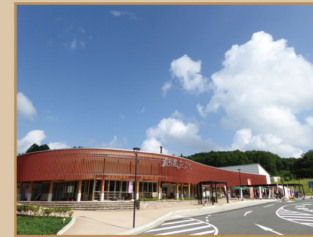
たかの(庄原市) 住所/庄原市高野町下門田49 電話/(0824)86-3131