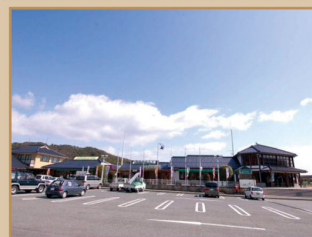
さんわ182ステーション(神石高原町) 住所/神石郡神石高原町坂瀬川15146-2 電話/(0847)85-2550