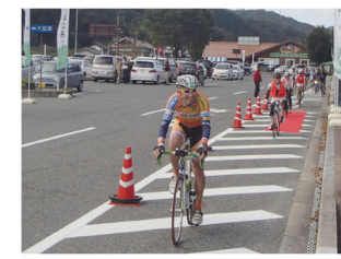
道の駅グルメライド

平成28年1月27日に、国道54号沿線の県境を跨いだ2市1町4つの道の駅が連携し、巡回バスの導入やサイクリングイベントなどの実施、冬季道路情報、防災・観光・移住等の情報を発信する取り組みが評価され重点「道の駅」に選定されました。これにより道の駅の関係機関連携による重点支援を受け、より一層の道の駅を核とした地域活性化に取り組んでいます。