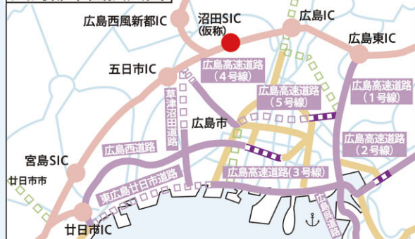
広島都市圏拡大図

今後の道路整備のマスタープランであり、具体的な路線のルート、位置等を規定するものではありません。