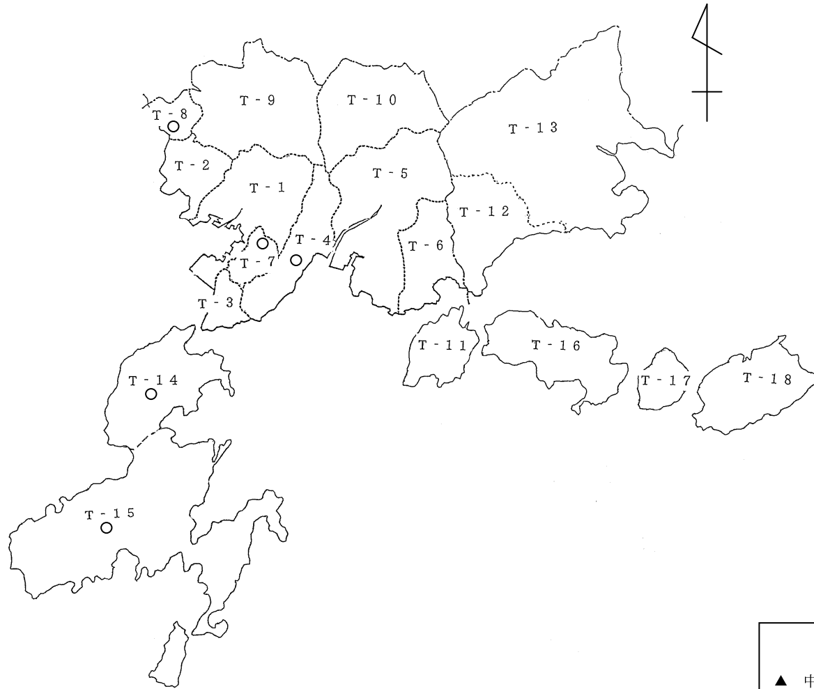
地下水調査測定点配置図 (4) (呉市の区域)