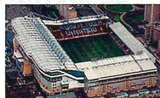
ブーリン・グラウンド (Boleyn Ground)