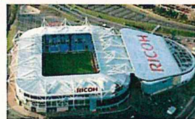
リコー・アリーナ (Ricoh Arena)