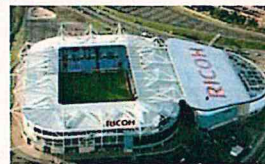
リコー・アリーナ (Ricoh Arena)