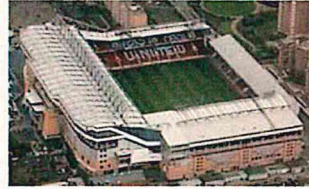
ブーリン・グラウンド (Boleyn Ground)