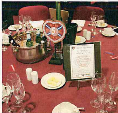
ゲストに満足してもらえるような雰囲気を出し出す(エジンバラ)