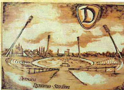
かつてのドレスデンのスタジアム。陸上競技のトラックがあり、屋根はなかった

スポーツが文化と認められる舞台は、競技の専門性と感動を最大限に引き出す「劇場」スタイルでなければならない。だから、サッカースタジアムは大前提となる。