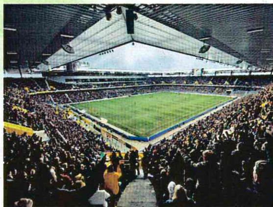
四方が屋根で覆われたスタジアム(スイスのベルンの絵はがきより)