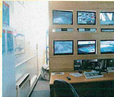
災害対策の拠点に欠かせない情報収集機能(英国のウェストブロムウィッチ)