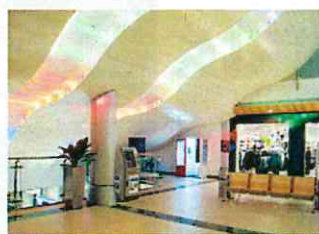
天井にスタンドの傾斜が分かるショッピングセンター内部(パーゼル)