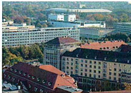
市街地にあるスタジアム(ドレスデン)

年間を通して週末ごとに、多いときには万人単位の巨大集客装置となる。千人単位のアウェイファン・サポーターも、試合の前後は「観光客」。スタジアムへのアクセスは徒歩が中心となり、観客が長く滞留する街の仕掛けがあれば、中心市街地に大きな経済効果をもたらす。