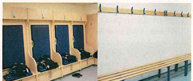
左がホーム用、右がアウェイ用(ウェストブロムウィッチのチーム更衣室)