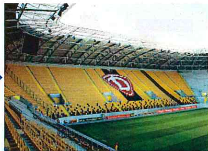
現在のドレスデンの新スタジアム