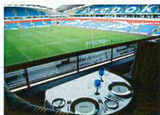
試合のない日もスタジアムのレストランで食事ができる(英国のボルトン)