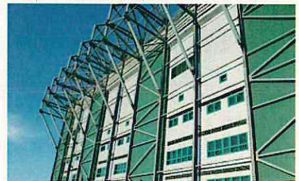
セルティック・パークの外壁(英国のグラスゴー)

エンブレム ユニフォームの左胸に配置されるのは、選手の心がクラブに帰属し、アイデンティティーの象徴を意味する。