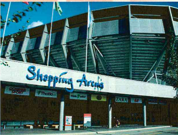
スタジアムに併設するショッピングセンター(ザンクトガレン)