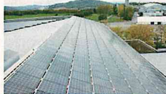
電力を供給するスタジアム屋根上のソーラーパネル(ベルン)