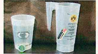
リユースカップはクラブ独自のデザイン(左はアイントラハト・フランクフルト、右はボルシア・ドルトムント。ともにドイツ)