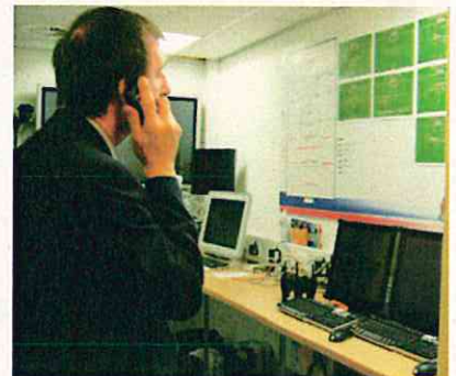
避難者への情報提供、告知、誘導機能も果たす(英国のボルトン)