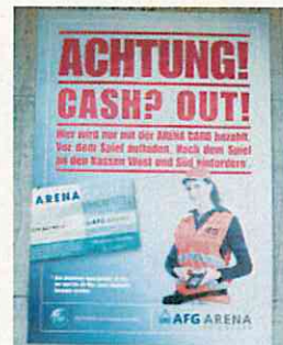
写真のカード販売員が コンコース内でチャージ もする(ザンクトガレン)