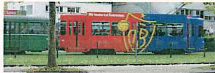
公共交通機関の利用を促進(バーゼル)