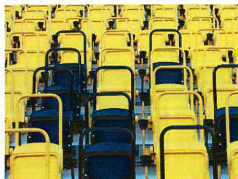
スタンド上部座席の安全柵(ドレスデン)