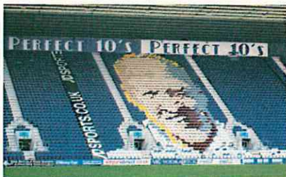
かつての名選手、ビル・シャンクリーの顔でホーム側とアウェイ側が仕切られるスタンド(英国のプレストン)