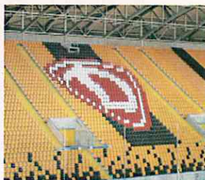
スタンドにも(ドレスデン)