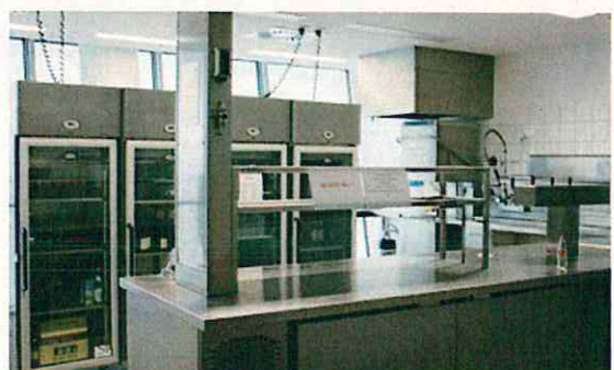
ラウンジの裏には広い厨房が完備している(ミュンヘン)