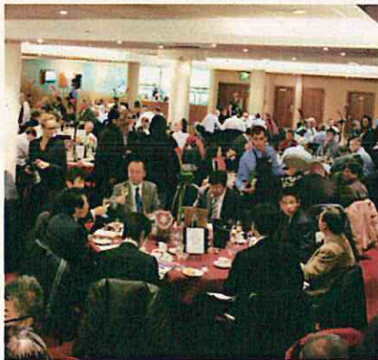
ラウンジの円形テーブルに集い、キックオフ前の時間を楽しむ(エジンバラ)

マクデブルクには、一般客向けのラウンジもある。メインスタンドの観戦チケット、ビュッフェ形式の食事とティーサービスが付き、日本円で一人約1万4000円。ラウンジ運営には、充実したケータリング設備とサービスが前提である。