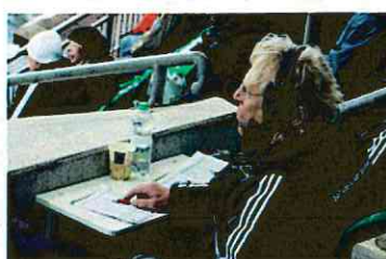
視覚障がい者のための実況放送(ヴォルフスブルク)