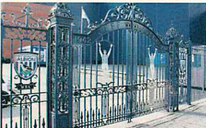
偉大なストライカー、ジェフ・アスルをたたえたゲート(ウェストブロムウィッチ)