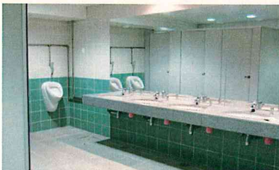
清潔で十分な数のトイレが各スタンドに。ポルトガルのスポルティング・リスボンの施設