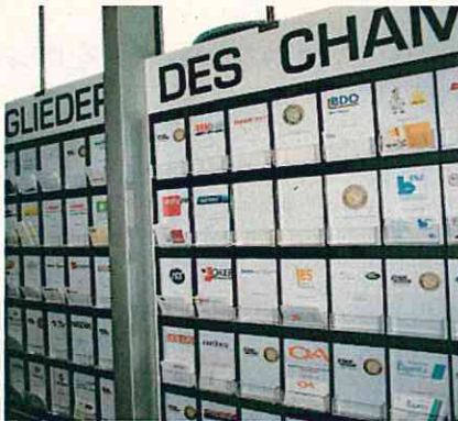
ビジネスチャンスが広がる名刺ボックス(ベルン)