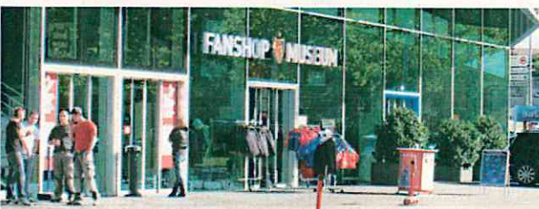
スタジアムに併設されたファンショップとミュージアム(バーゼル)