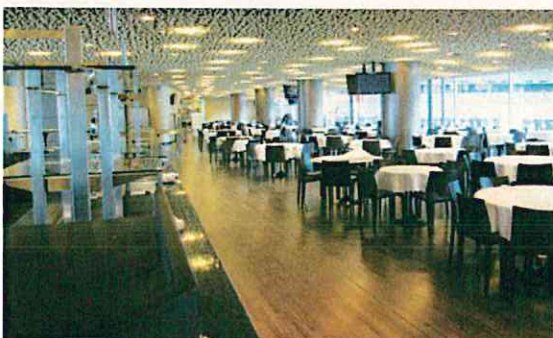
温かい食事を取ることができる広いラウンジ(ミュンヘン)