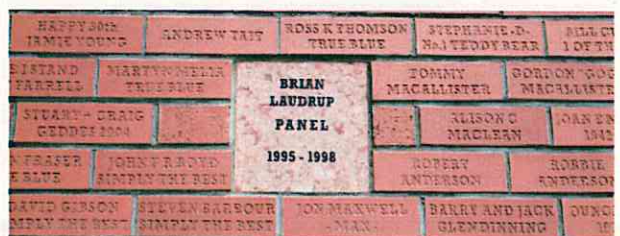
購入したブロックに自分の名前を彫り、外壁に張られる(レンジャーズ、グラスゴー)