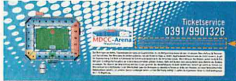
コンビチケットの例(マクデブルク)