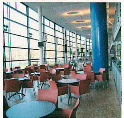
シンプルなラウンジ(デュイスブルク)