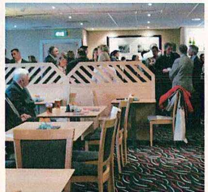
試合後のティーサービス(英国のシェフィールド・ユナイテッド)