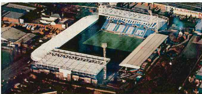
現在の欧州では箱型の「サッカースタジアム」が主流（英国のウェストブロムウィッチ）