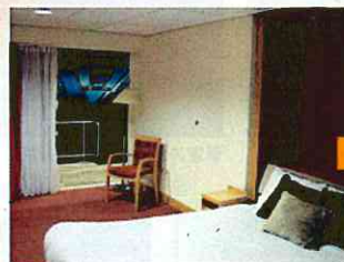
ピッチに面したホテルの客室(英国のコベントリー)