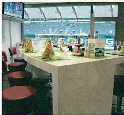
個室スカイボックス。契約企業は独自にインテリアをデザイン(ともにヴォルフスブルク)