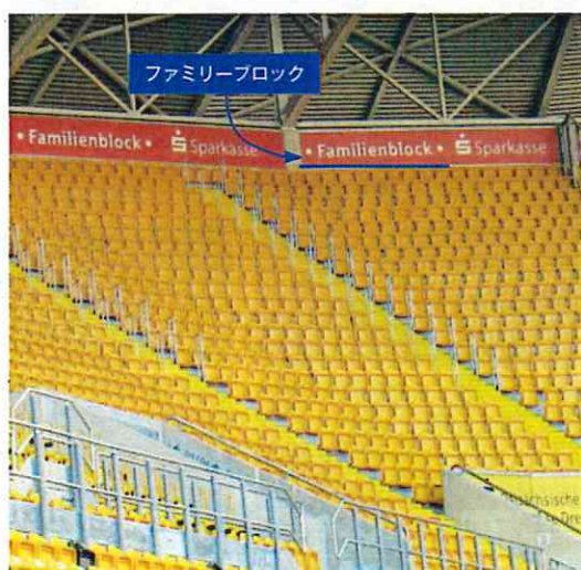
赤い看板の下のブロックがファミリースタンド(ドレスデン)