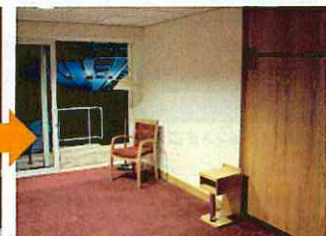
試合当日はベッドを収納し、スカイボックスとして使用