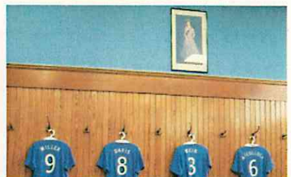
エリザベス女王の写真の真下はキャプテンの位置と決まっている(レンジャーズ、グラスゴー)