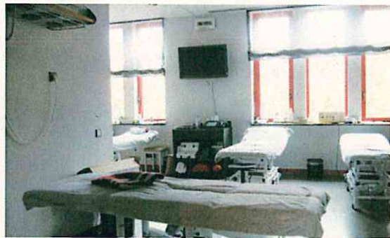
負傷者の応急手当て、医療機関への誘導の中核となる医務室、救護室。ドイツのバイエルン・ミュンヘンの施設