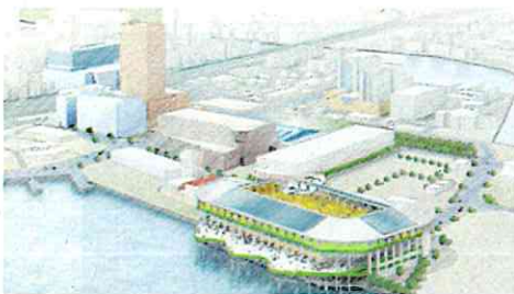
北九州市が打ち出した新スタジアム構想図(2010年11月17日の記者発表資料より)

わが国でも2010年11月、北九州市が新幹線小倉駅の北500メートルに、ギラヴァンツ北九州(J2)のホームスタジアムとして街なかスタジアム計画を打ち出した。