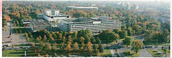
緑に囲まれたスタジアム(ドレスデン)