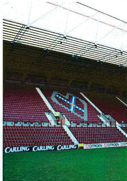
スタンドの傾斜角がピッチを近づける。最大で40度のところも（エジンバラ）

陸上競技のトラックがあると、Jリーグのスタジアムのゴール裏で最長45メートルもピッチから離れ、試合が見つらく、選手もプレーしにくい。サッカースタジアムはどの角度からも選手と観客の距離が近く、一体感が生まれる。芝生の緑、カラーコントラストの効いた両チームのユニフォーム、プレーに反応して波打つ観客、すべての臨場感が一つの画面から伝わってくる。