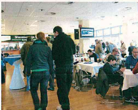
一般客向けのラウンジ(マクデブルク)