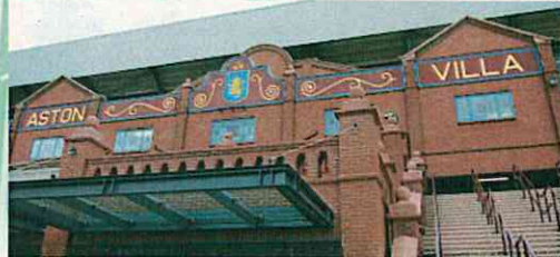
エンジと水色が外壁に。アストン・ビラのピラパーク(英国のバーミンガム)

クラブカラーは「ホームタウンの色」、一目で味方と対戦相手が識別できる。クラブカラー一色に染まったスタジアムから、選手は心理的優位をもらい、市民は誇りを抱く。