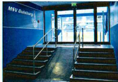
下からの選手入場口（ドイツのデュイスブルク）