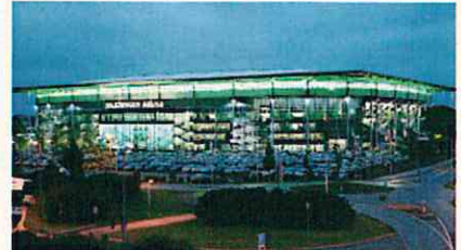
緑にライトアップ(ドイツのヴォルフスブルク)