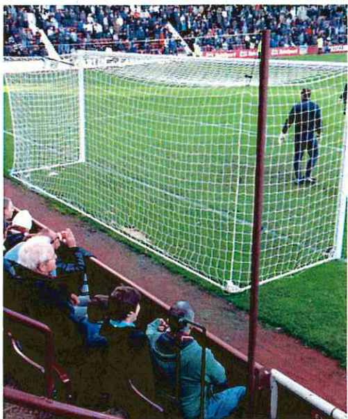
ゴール裏の席はネットに手が届きそうな近さ（英国のエジンバラ）