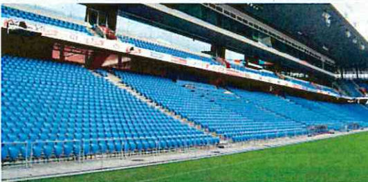
最前列の席はピッチと同じ目線に（スイスのバーゼル）

2010年6月に開催された第11回全国ホームタウンサミットin甲府の参加者約300人によって、「最もお気に入りのJリーグホームスタジアム」に選ばれたベスト5は、すべてサッカースタジアムだった。