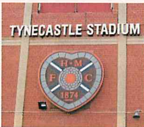
表札として(エジンバラ)

エンブレム ユニフォームの左胸に配置されるのは、選手の心がクラブに帰属し、アイデンティティーの象徴を意味する。