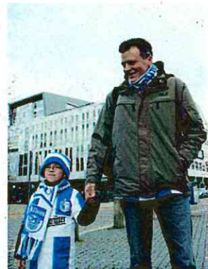
マクデブルク (ドイツ)の親子連れ

性別、年齢、ハンディを超えて、誰もが安心して楽しめる空間。 交通アクセス、屋根のある個席、ナイター照明、バリアフリー