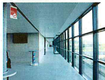
ラウンジなどとしても利用できる快適なコンコース (スイスのザンクトガレン)