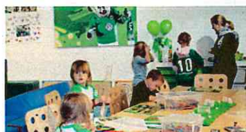
スタジアム内の託児施設(ヴォルフスブルク)