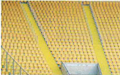
スタンドから階段までも(ドレスデン)