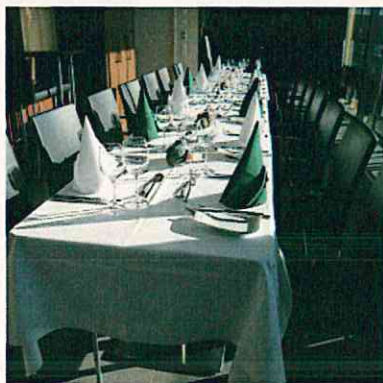
14人用個室ラウンジ(ザクトガレン)