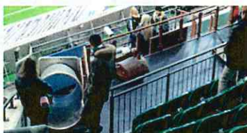
保護者も安心のキッズスペース(ヴォルフスブルク)