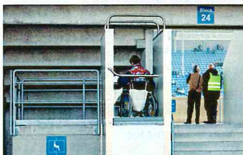
車椅子用の専用リフトが稼働中(マクデブルク)