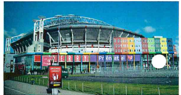
ショッピングモール(手前)とアムステルダム・アレナ(オランダ)

郊外の再開発プロジェクトの核として、面開発の複合型の街づくりが行われる。公共交通や十分な駐車場整備に加え、パーク&ライド整備が必要である。