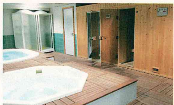
温水シャワーだけでなく、バスタブも完備(リスボン)