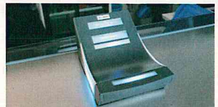
物販、飲食はこのカードリーダーで電子決済(ザンクトガレン)