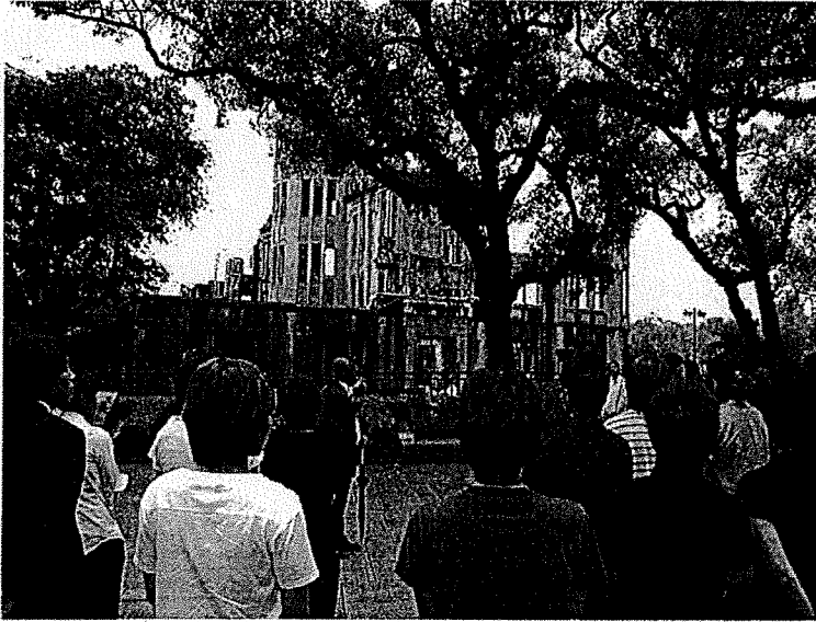
なでしこリーグ オールスター 原爆の説明を受ける (全選手・スタッフ 36名)

なでしこリーグ オールスター戦（エディオンスタジアム開催）の前日、全選手・スタッフは平和公園を訪れ、慰霊碑で献花、黙祷されました。