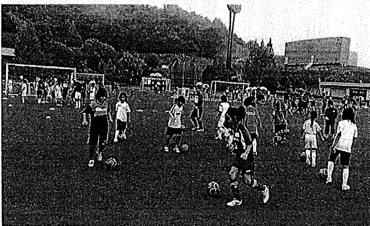
試合当日、隣接グラウンドにて 小中学生の女子対象の 「未来のなでしこサッカー教室」 大雨の中、200名が参加