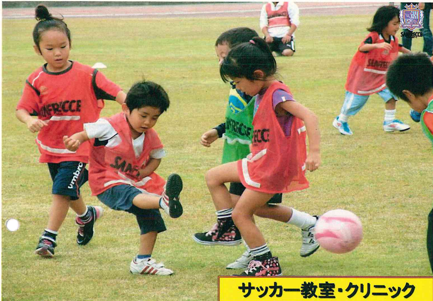
サッカー教室・クリニック