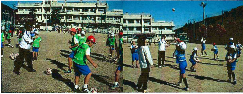
(じゃんけんゲーム)