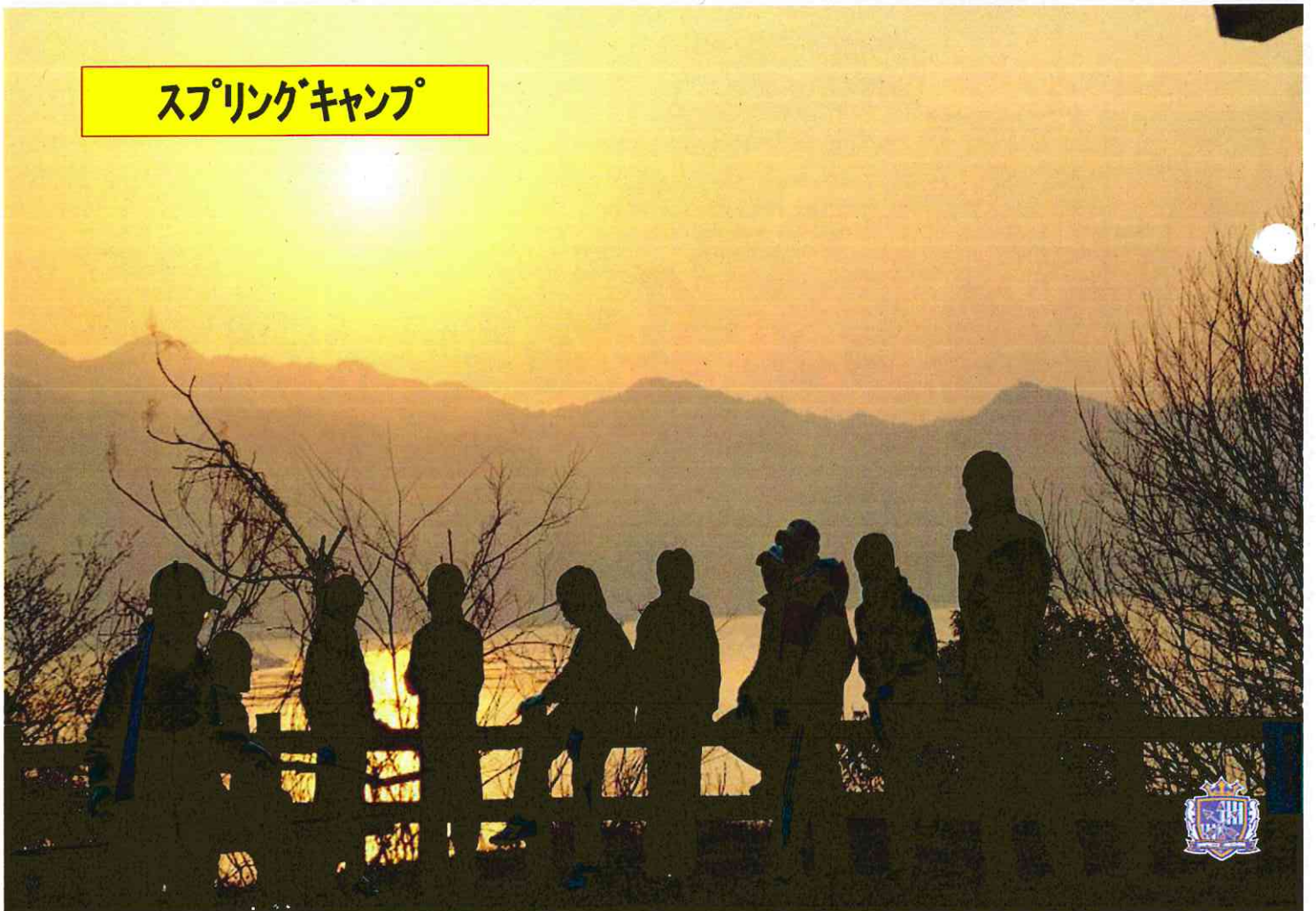
スプリングキャンプ