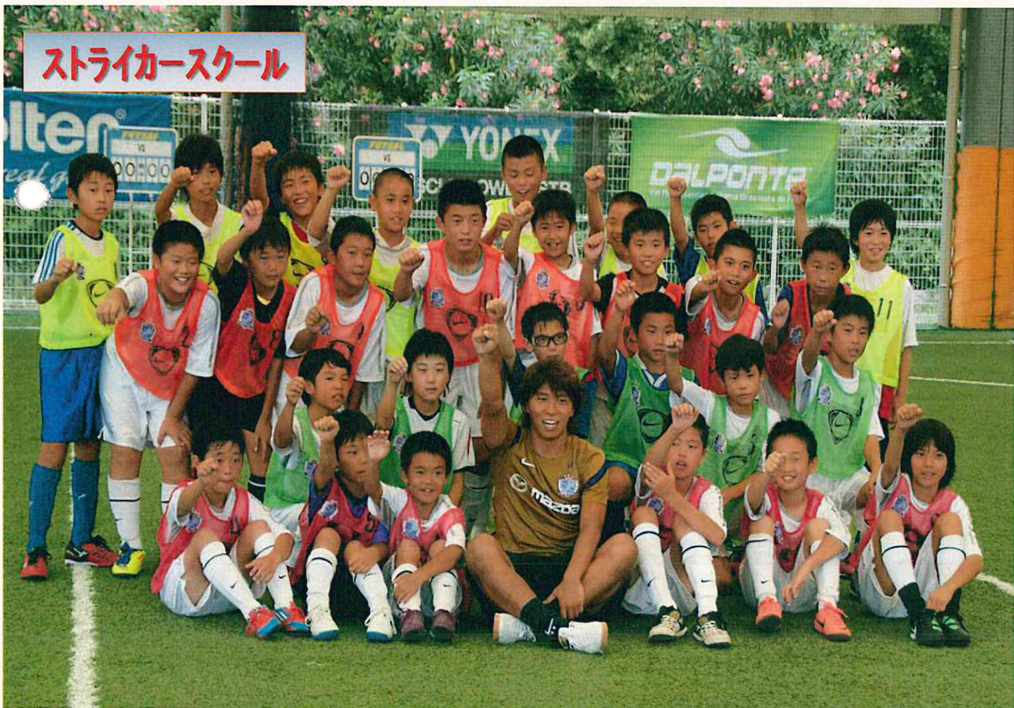
ストライカーズスクール