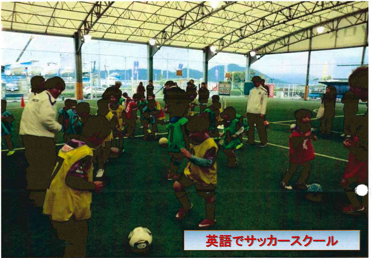
英語でサッカースクール