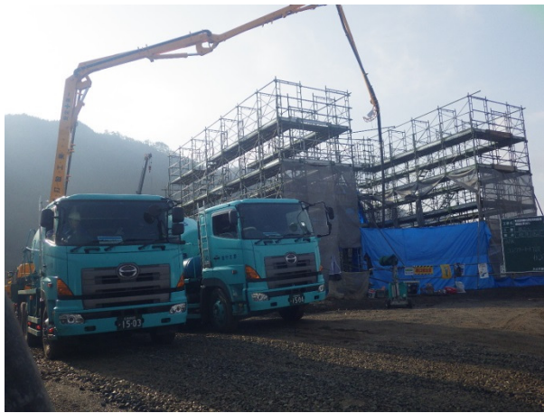
下部工(橋台)のコンクリート打設状況