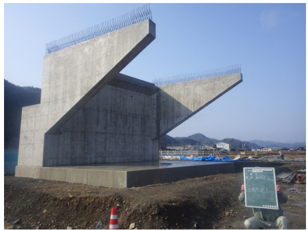
下部工(橋台)の完成状況