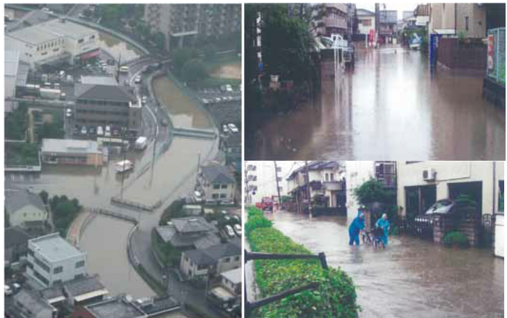
平成22年7月の被害状況

これにより、平成22年7月の梅雨前線豪雨に相当する洪水が発生しても、床上浸水による被害を防ぎます。