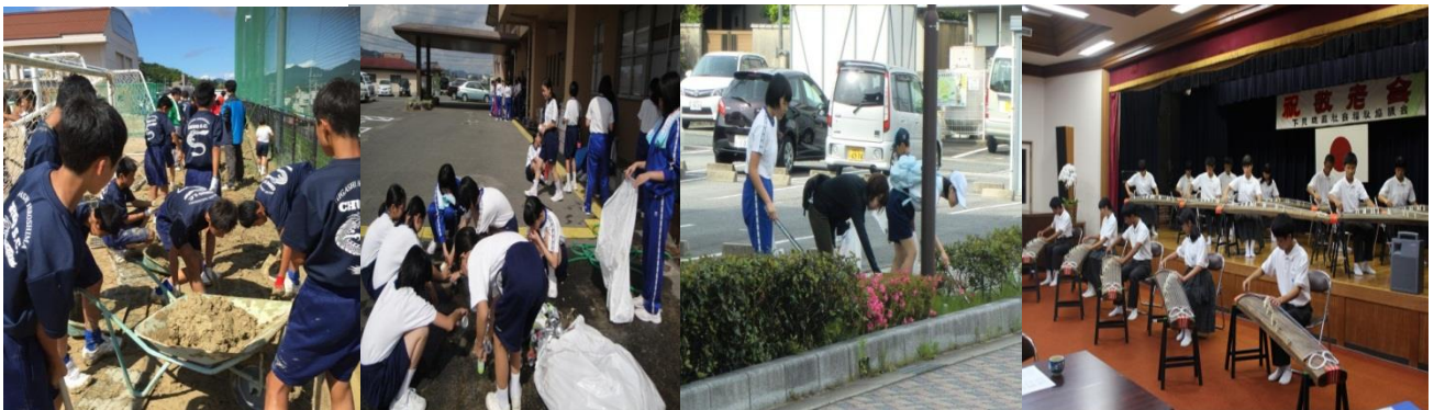
小学校の手伝い 地域の資源回収 通学路のゴミ拾い 地域の敬老会へ出演