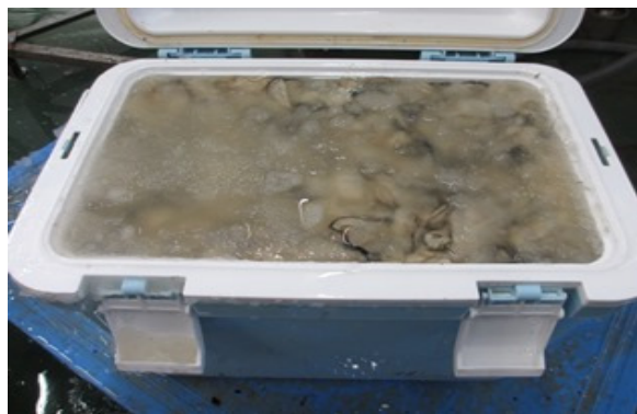
海水氷で冷却されたむき身(専用クーラーボックス)