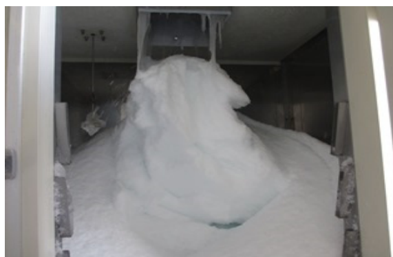
専用の製氷機により作られた海水氷(フレーク状)