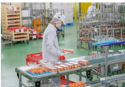
GPセンターでの最終検品の様子