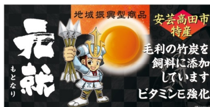
パネル(30cm × 60cm)