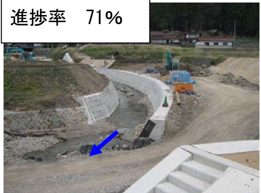
工事延長 L=380m 施工：加島建設 工期：H23.12～H24.6(予定)