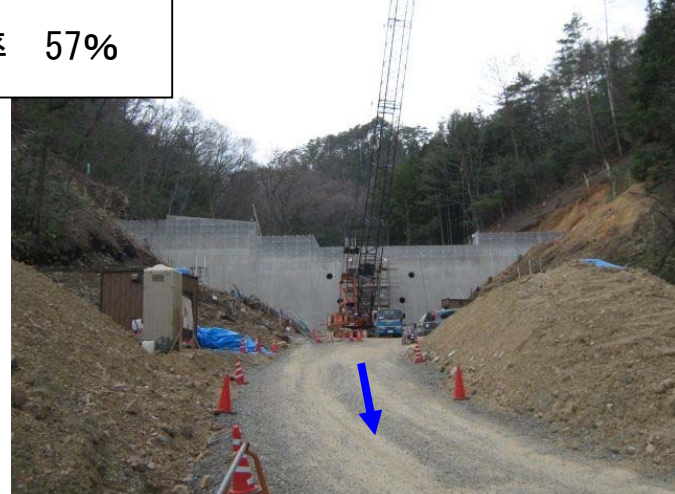
工事内容：コンクリートえん堤 1基 施工：宮田建設 工期：H23.10～H24.7(予定)