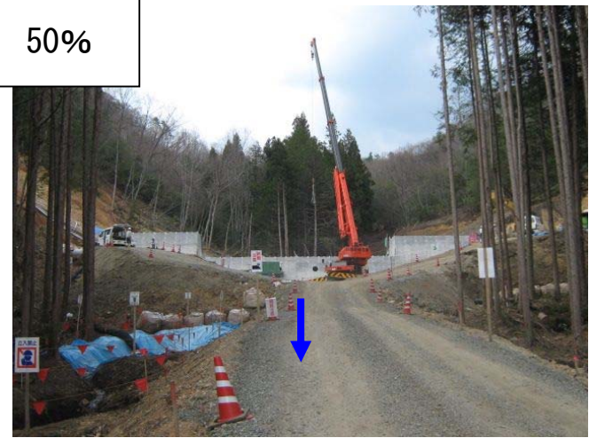
工事内容：コンクリートえん堤 1基 施工：山陽工業 工期：H23.9～H24.7(予定)