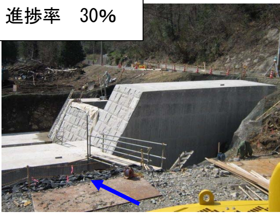
工事内容：コンクリートえん堤 2基 施工：大歳組 工期：H23.12～H24.8(予定)