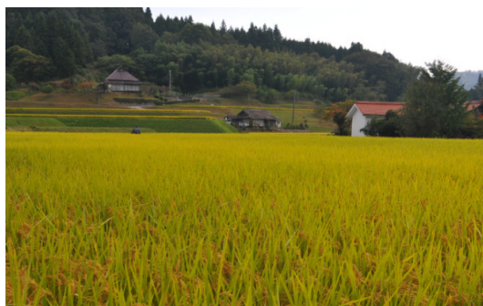
豊穰神楽米の圃場写真